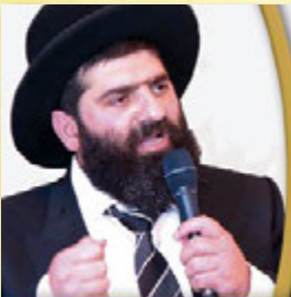
שיעור הרב השבוע בכפר סבא