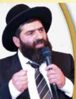
שיעורי הרב השבוע

ההרשמה נסגרה - ניתן להרשם לכנס הבא בעזה"י