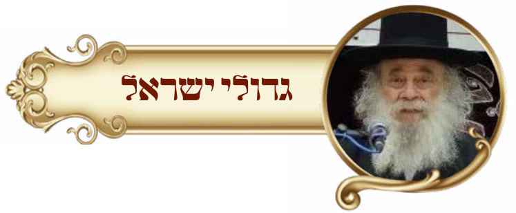
רבי אברהם גניחובסקי זצ"ל