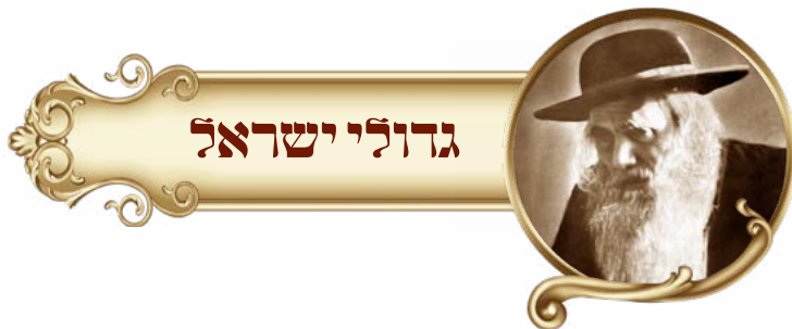
הרב יוסף חיים זוננפלד זצ"ל